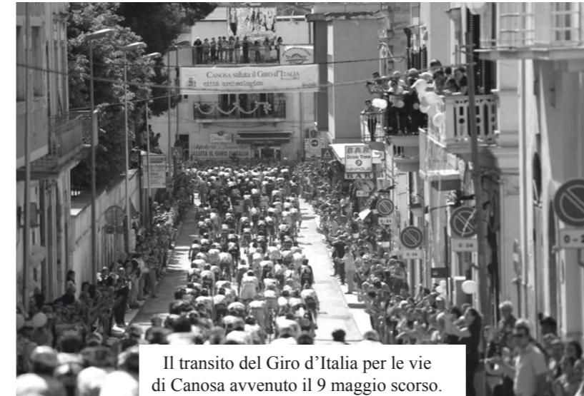
Il transito del Giro d'Italia per le vie di Canosa avvenuto il 9 maggio scorso.