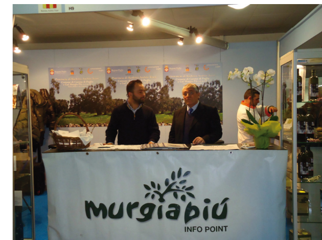
Assessore Piscitelli alla Fiera "Olio Capitale" di Trieste

Per quanto concerne la formazione dei produttori locali, a settembre abbiamo avviato il corso gratuito per conseguire il Bollettino Fitosanitario e il corso sull'uso dei fitofarmaci. La soddisfazione maggiore, però, è venuta dai corsi di avvicinamento all'olio extravergine di oliva, proposti più volte nell'arco dell'anno, aperti non soltanto ai produttori ma anche ai ristoratori e agli appassionati. A questi si sono aggiunti i corsi tecnici per aspiranti assaggiatori di olio di oliva vergine mentre il 19 giugno partirà il corso di avvicinamento al vino.