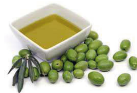
Corso di avvicinamento all'olio extra vergine d'oliva

Agricoltura e produzione, come ben si sa, sono strettamente correlate alla situazione meteorologica. Purtroppo questa annata è stata caratterizzata da nubifragi (il 2 e il 4 settembre) e da pioggia alluvionale e grandine (il 6 maggio): le conseguenze sulle nostre colture sono state considerevoli, pertanto abbiamo chiesto alla Regione Puglia lo stato di calamità naturale per i danni subiti dalla colture agricole nell'agro di Canosa. Inoltre, siamo in contatto con il Consorzio di Bonifica "Terre d'Apulia" per assicurare l'erogazione di acqua, ovviando così agli inconvenienti logistici che, come l'anno scorso, hanno causato ritardi alla campagna irrigua.